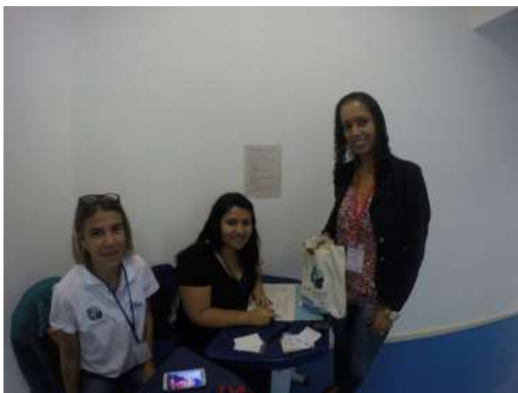
Figura 8- Credenciamento dos participantes

SEMEIA GUANDU Atitude e Sustentabilidade