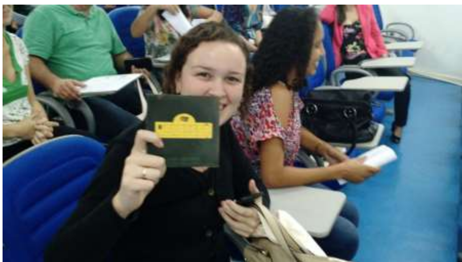
Figura 18 - Participante recebendo seu brinde

SEMEIA GUANDU Atitude e Sustentabilidade