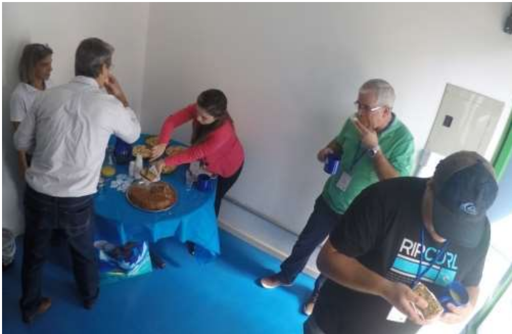
Figura 5- Coffee break da tarde

SEMEIA GUANDU Atitude e Sustentabilidade