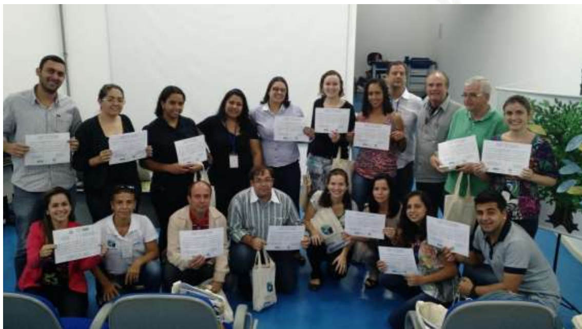
Figura 20 - Participantes com seus certificados

Para finalizar o Seminário, os participantes receberam seus certificados (Figura 20).