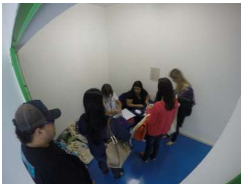
Figura 6 - Credenciamento dos participantes

SEMEIA GUANDU Atitude e Sustentabilidade