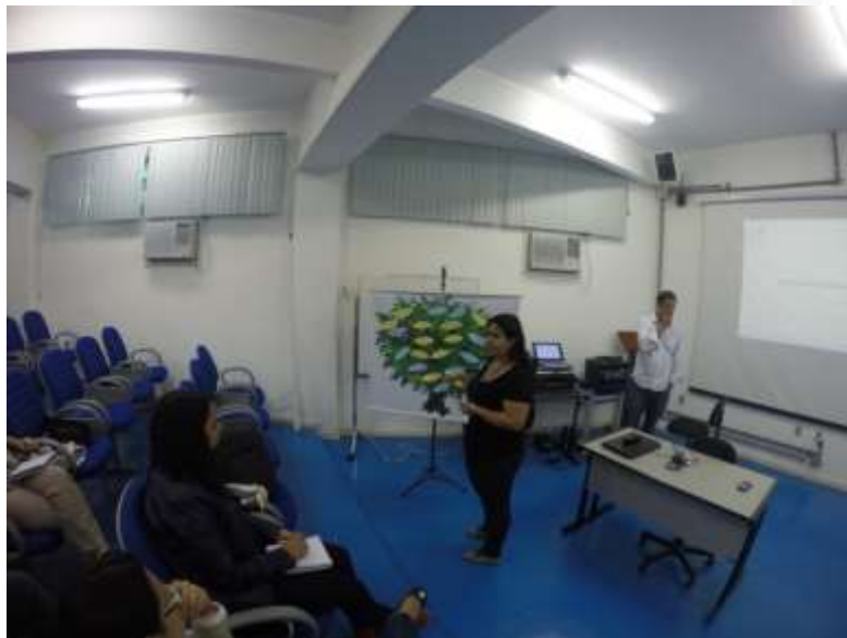
Figura 9- Oficina árvore dos sonhos

Esta atividade foi norteadora de todas as outras atividades deste dia de evento.