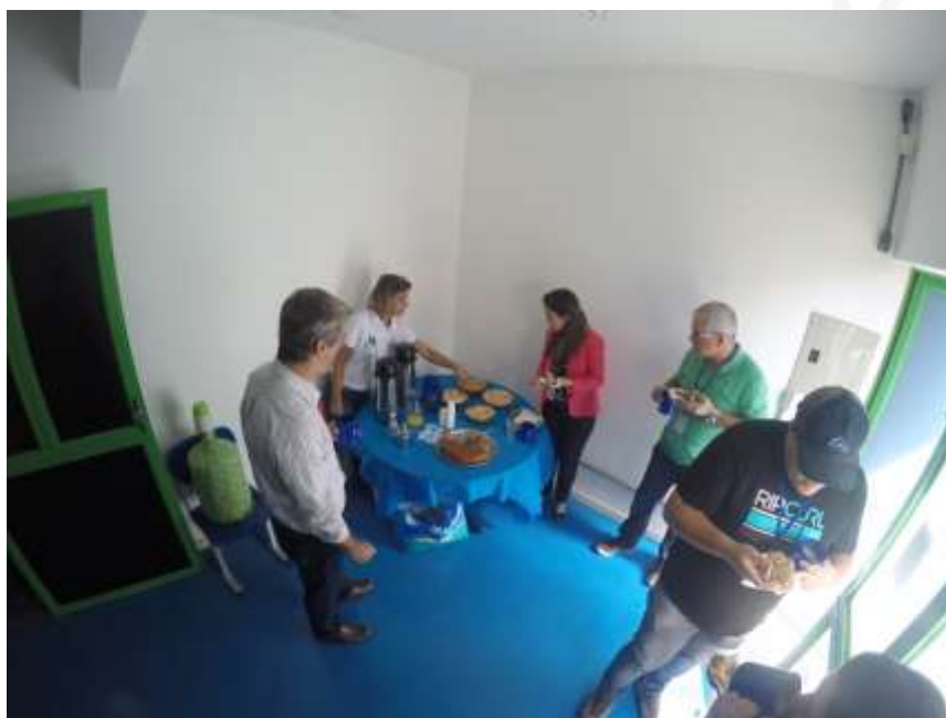
Figura 10- Coffee break

Os participantes tiveram duas pausas para um lanche ( figura 10 ), uma pela manhã e outra no meio da tarde, fornecido pelo Projeto Semeia Guandu. Este é um momento de integração entre os participantes.