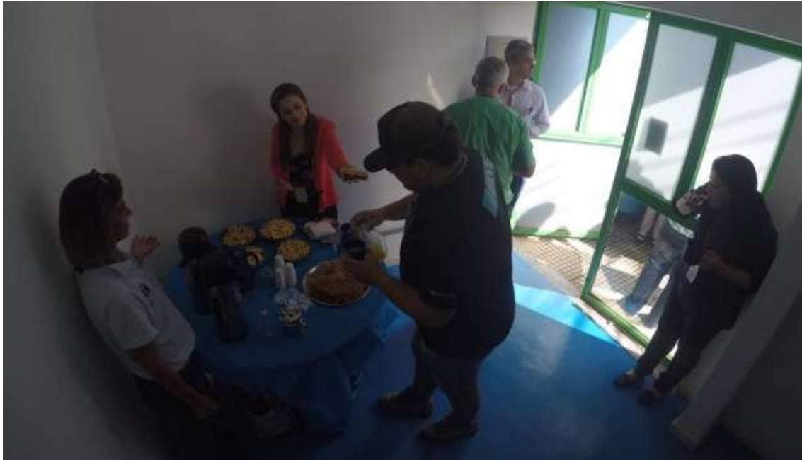
Figura 4- Coffee Break da manhã

SEMEIA GUANDU Atitude e Sustentabilidade