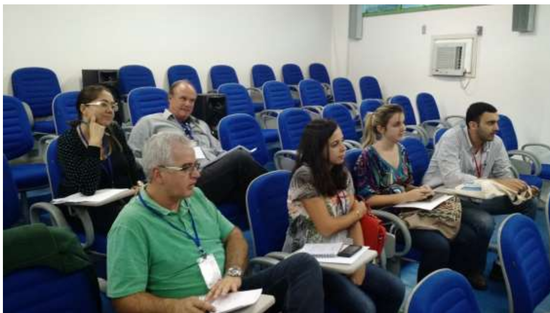
Figura 14 - Grupo de Projetos de saneamento e infraestrutura

SEMEIA GUANDU Atitude e Sustentabilidade