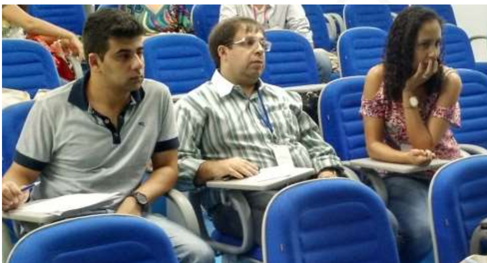
Figura 12 - Grupo de Projetos de Reflorestamento

saneamento e infraestrutura ( figura 14 ) e projetos de coleta seletiva ( figura 15 ).