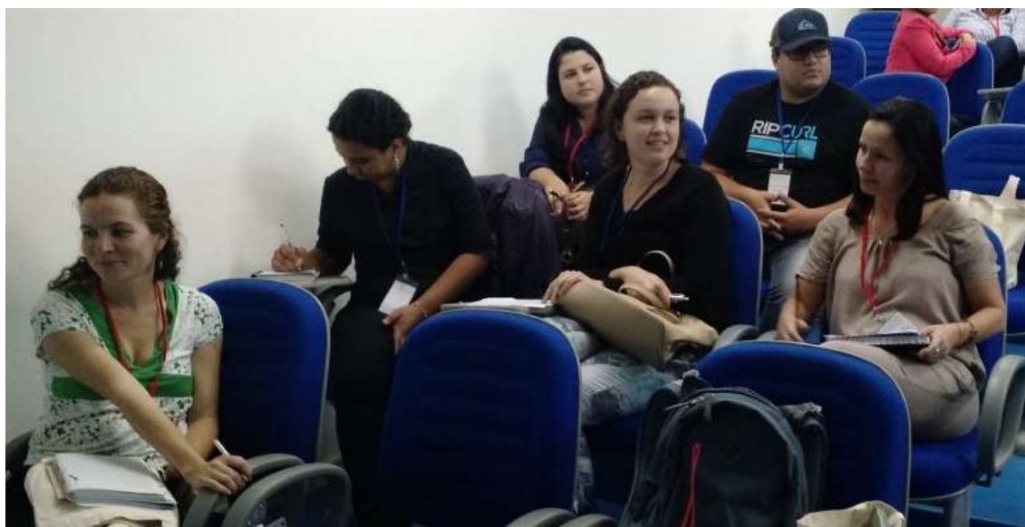
Figura 15 - Grupo de Projetos de Coleta Seletiva

SEMEIA GUANDU Atitude e Sustentabilidade