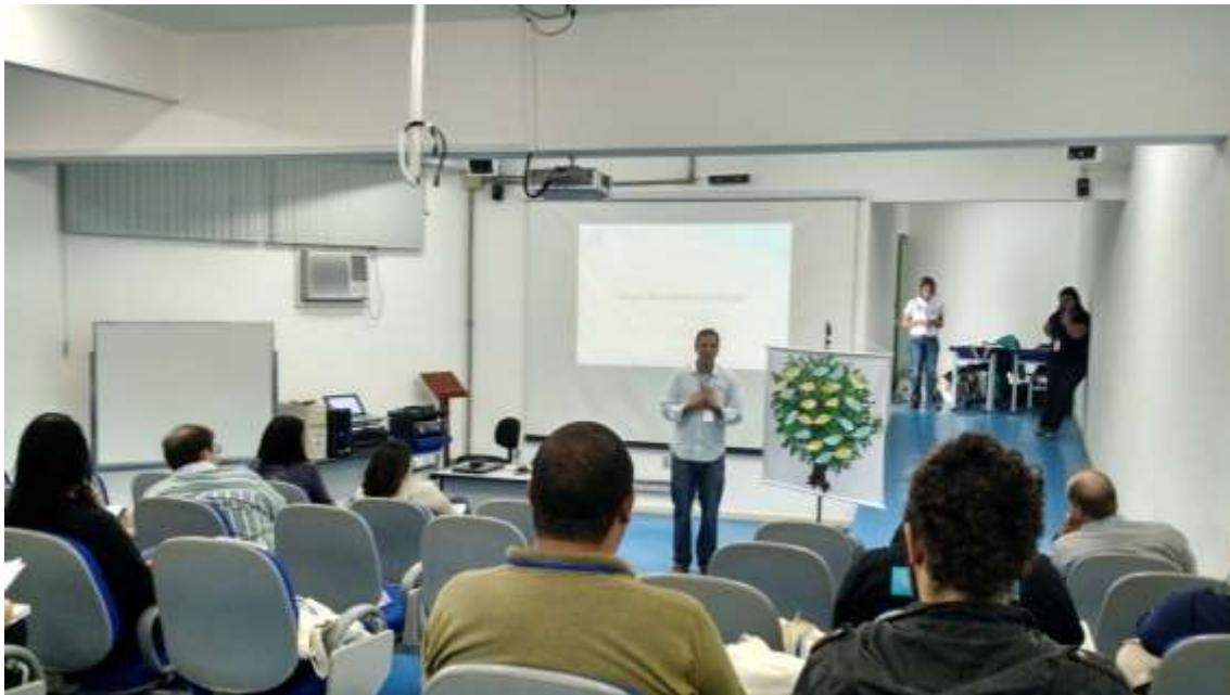
Figura 10 - Minicurso Elaboração de Projetos

SEMEIA GUANDU Atitude e Sustentabilidade