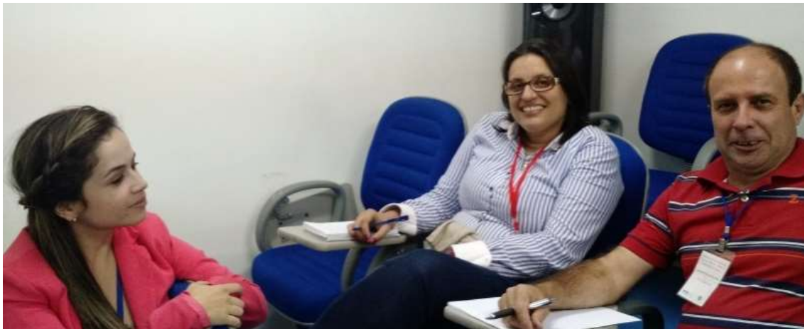
Figura 13 - Grupo de Projetos de Educação Ambiental

SEMEIA GUANDU Atitude e Sustentabilidade