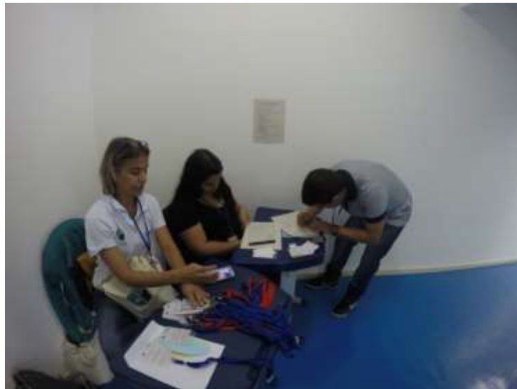
Figura 7- Credenciamento dos participantes

SEMEIA GUANDU Atitude e Sustentabilidade