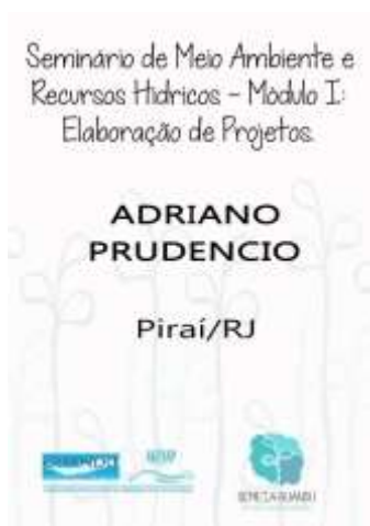
Figura 3 – Crachá

SEMEIA GUANDU Atitude e Sustentabilidade