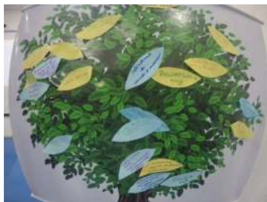
Figura 2 - Painel de lona usado em dinâmica árvore dos sonhos

SEMEIA GUANDU Atitude e Sustentabilidade