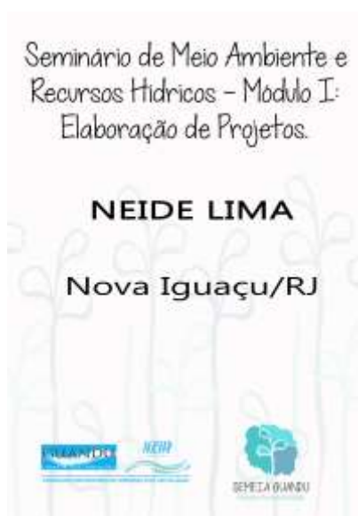
Figura 3– Crachá

SEMEIA GUANDU Atitude e Sustentabilidade