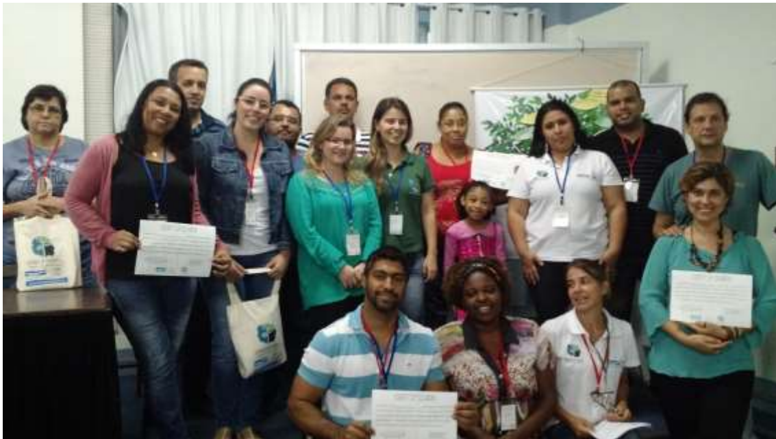
Figura 17 - Participantes com seus certificados

SEMEIA GUANDU Atitude e Sustentabilidade