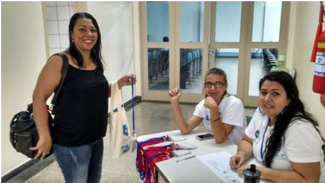
Figura 6 - Credenciamento dos participantes

SEMEIA GUANDU Atitude e Sustentabilidade