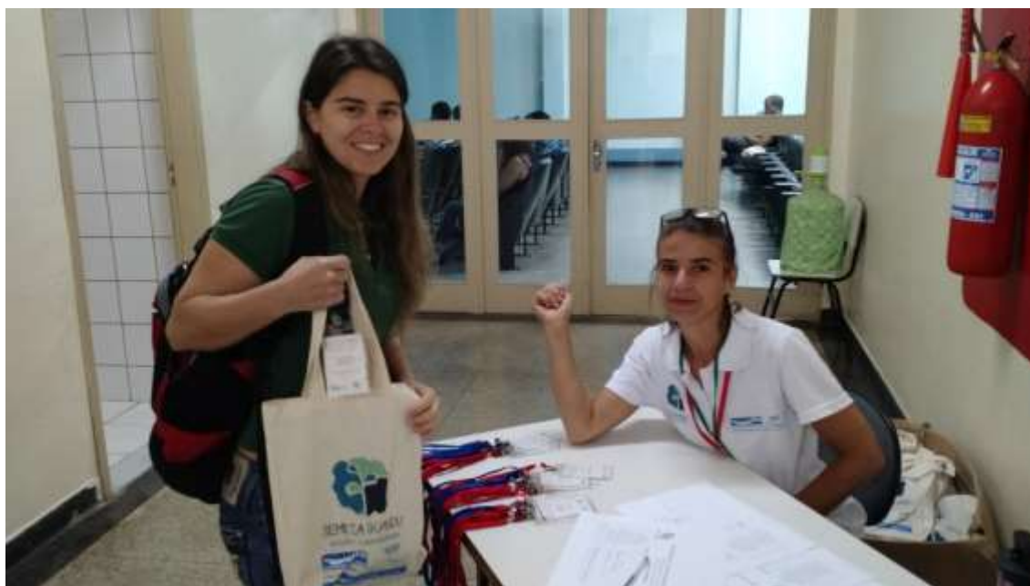
Figura 8- Credenciamento dos participantes

SEMEIA GUANDU Atitude e Sustentabilidade