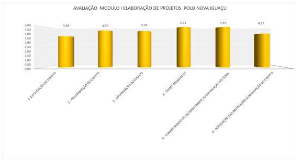
Grafico1- Resultado da avaliação do evento

SEMEIA GUANDU Atitude e Sustentabilidade