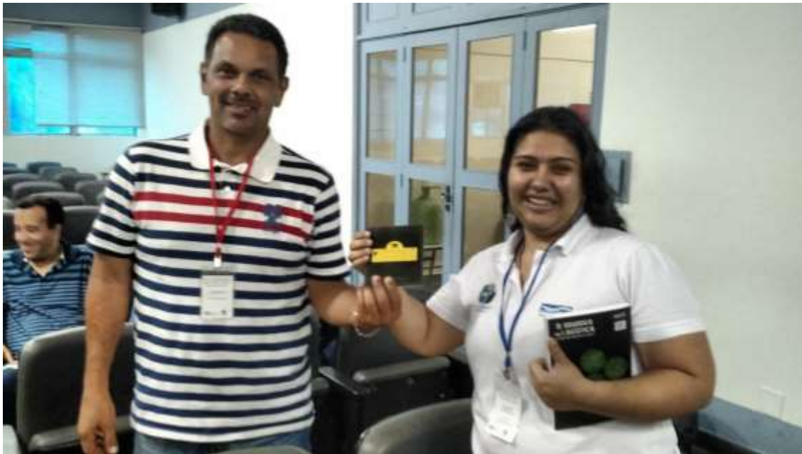
Figura 15 -Participante recebendo brinde

SEMEIA GUANDU Atitude e Sustentabilidade