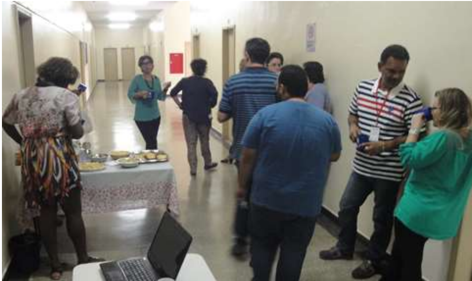
Figura 4- Coffee Break da manhã

SEMEIA GUANDU Atitude e Sustentabilidade