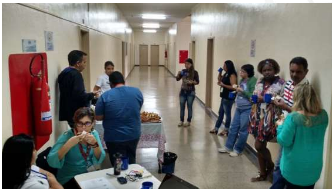
Figura 10- Coffee break

Os participantes tiveram duas pausas para um lanche ( figura 10 ), uma pela manhã e outra no meio da tarde, fornecido pelo Projeto Semeia Guandu. Este é um momento de integração entre os participantes.