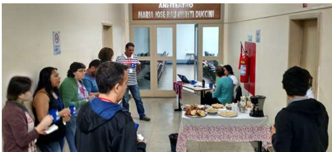
Figura 5- Coffee break da tarde

SEMEIA GUANDU Atitude e Sustentabilidade