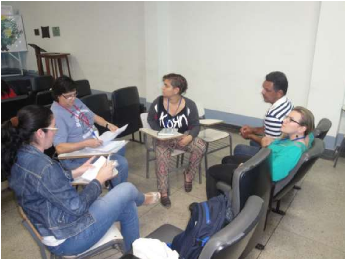
Figura 12 - Grupo de Projetos de Reflorestamento

SEMEIA GUANDU Atitude e Sustentabilidade