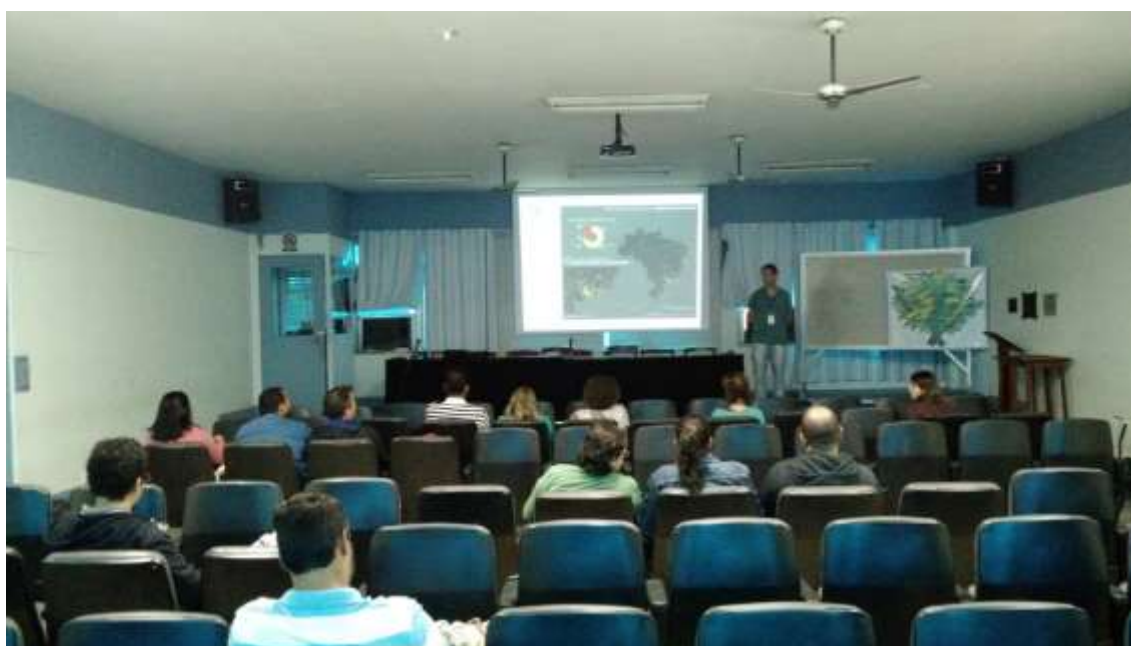
Figura 10 -Minicurso Elaboração de Projetos

SEMEIA GUANDU Atitude e Sustentabilidade