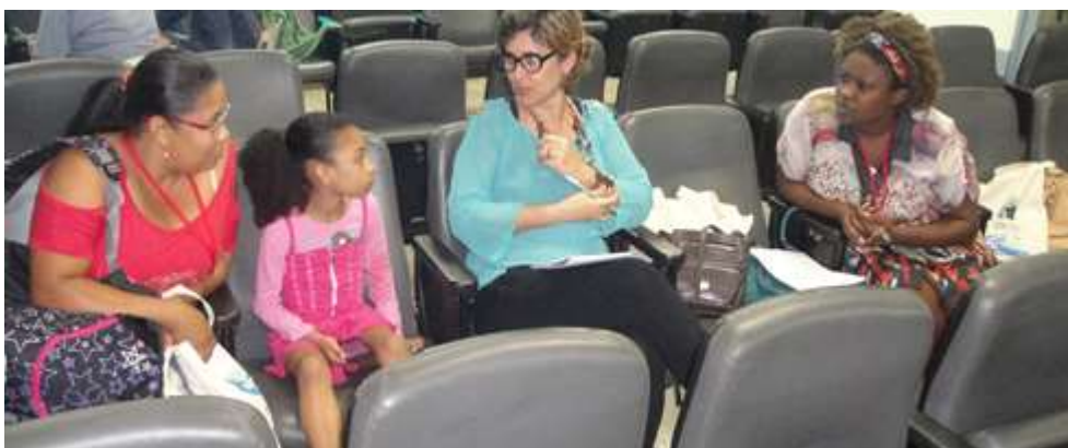
Figura 13 - Grupo de Projetos de Educação Ambiental

SEMEIA GUANDU Atitude e Sustentabilidade