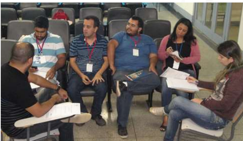
Figura 14 - Grupo de Projetos de saneamento e infraestrutura