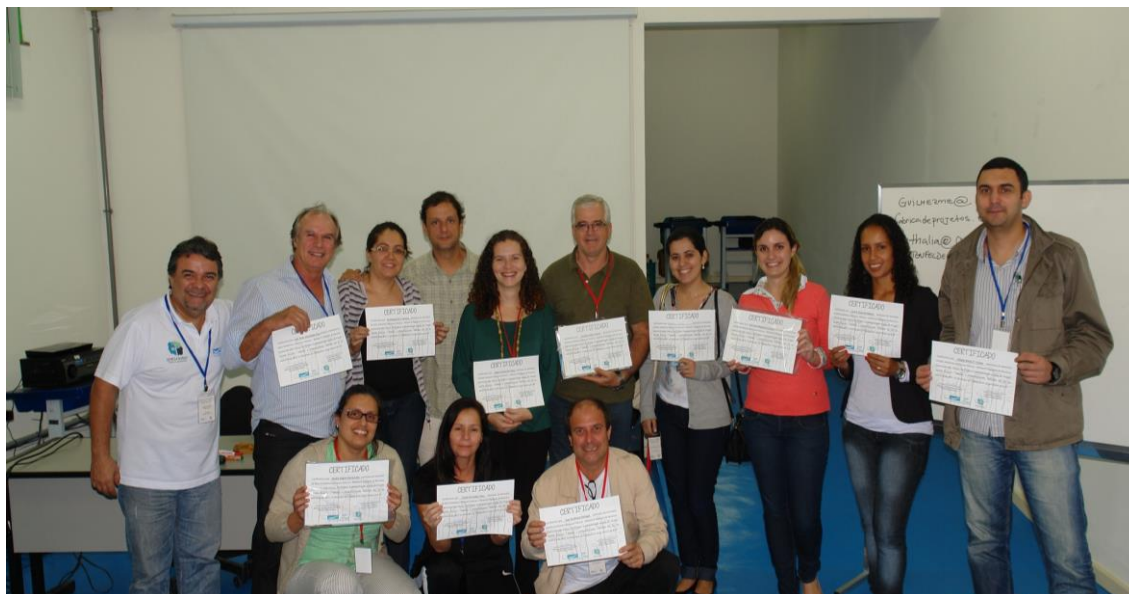
Figura 11: Participantes com seus certificados

SEMEIA GUANDU Atitude e Sustentabilidade