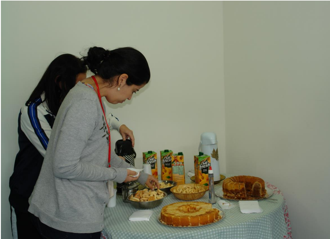
Figura 3- Coffee Break da manhã

SEMEIA GUANDU Atitude e Sustentabilidade