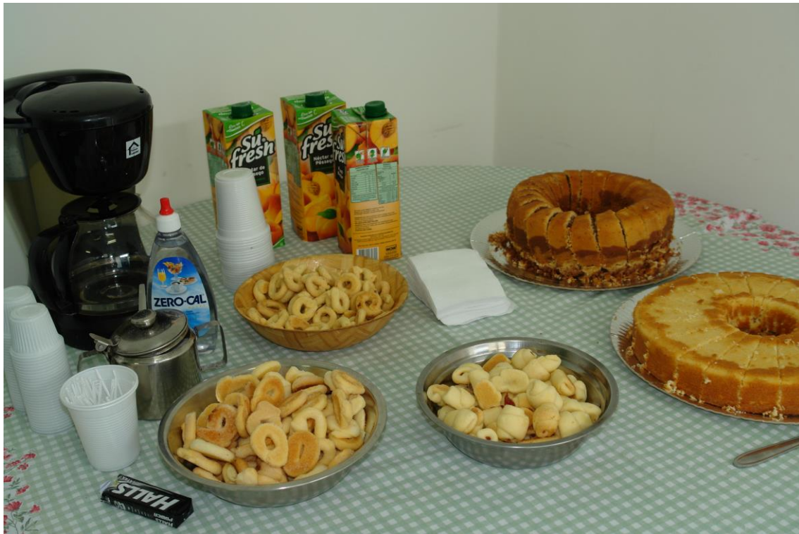
Figura 4: Coffee Break da tarde

SEMEIA GUANDU Atitude e Sustentabilidade