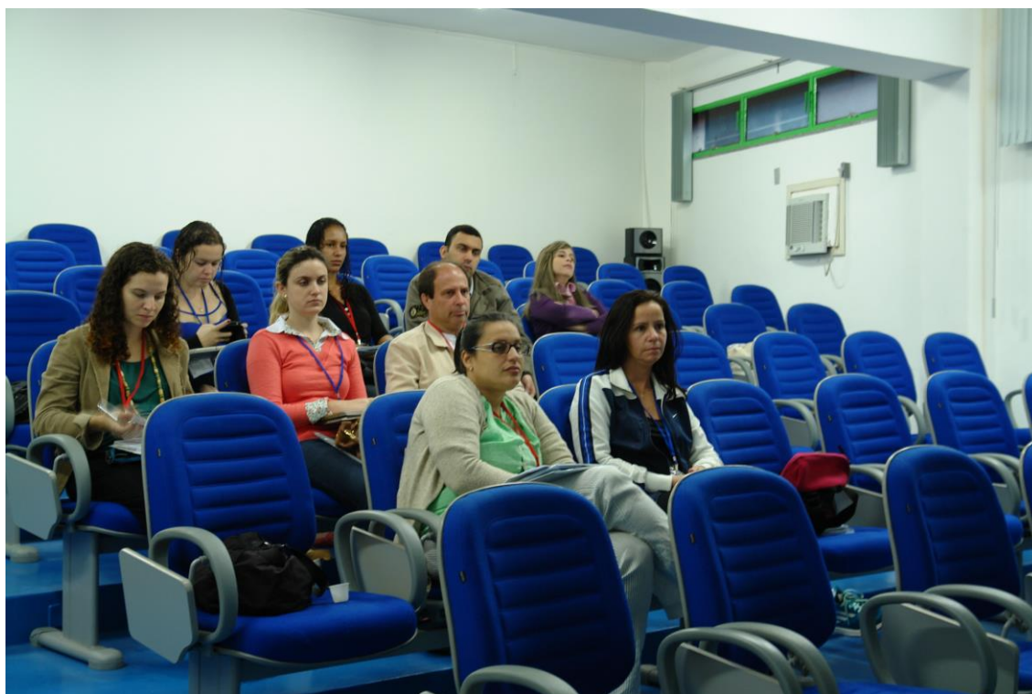
Figura 8: Participantes do minicurso de captação de recursos

SEMEIA GUANDU Atitude e Sustentabilidade