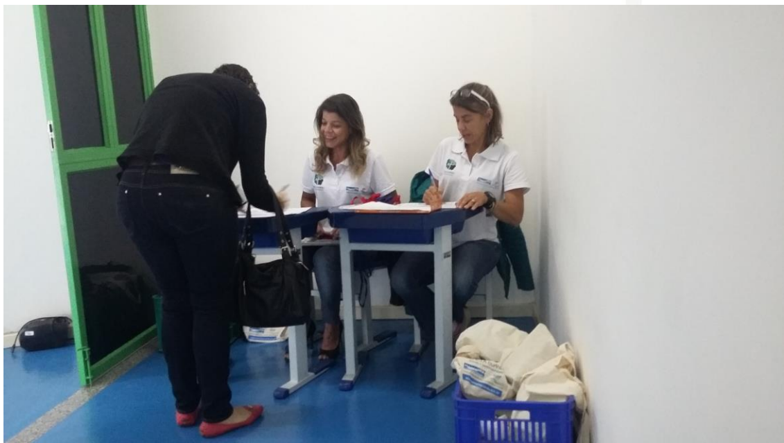
Figura 6: Credenciamento dos participantes

No primeiro momento das 08h30min às 09h00min, foi feito o credenciamento dos participantes no seminário, onde estes assinaram a lista de presença, receberam seu respectivo crachá e kit com bolsa, caneca, sendo um kit por participante para todo o Seminário de Meio Ambiente e Recursos Hídricos, reafirmando a proposta do uso contínuo evitando sacolinhas e copos descartáveis. Também faz parte do kit o material de divulgação do Comitê Guandu, cedido pela AGEVAP ( figura 6 ).