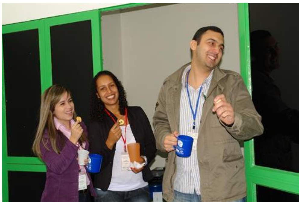
Figura 5: Participantes no momento do coffee break

SEMEIA GUANDU Atitude e Sustentabilidade